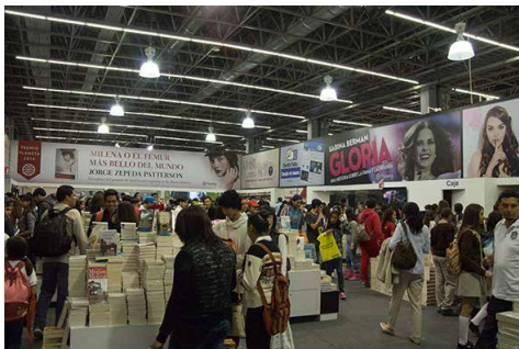
FIL 2014.

La FIL 2014 fue de matices casi esquizofrénicos. Por un lado, los sentidos se entusiasmaban al ver